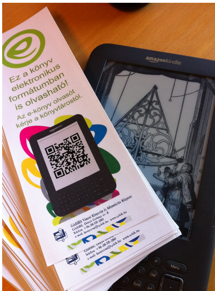
3. kép A könyvekbe tűzött figyelemfelhívó könyvjelzőink