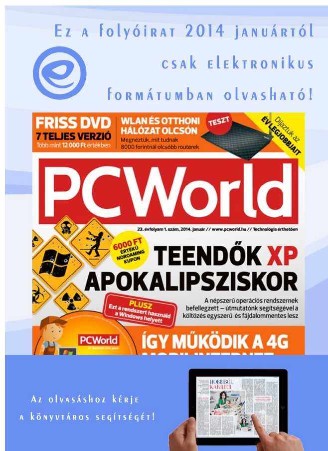
9. kép Figyelemfelhívó anyagaim