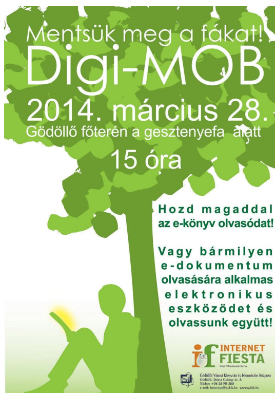
5. kép Digi-MOB-ra készített plakát/szóróanyag