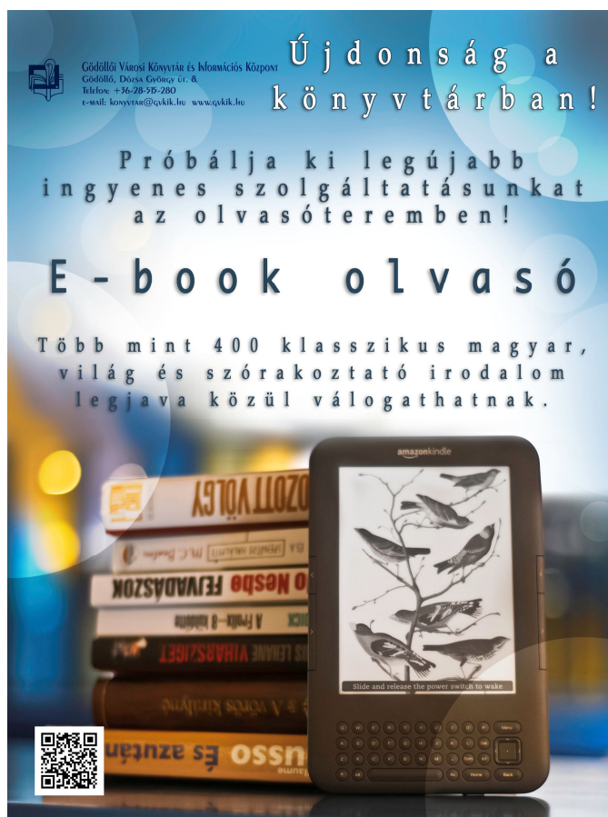
2. kép E-könyv olvasó hirdetésünk