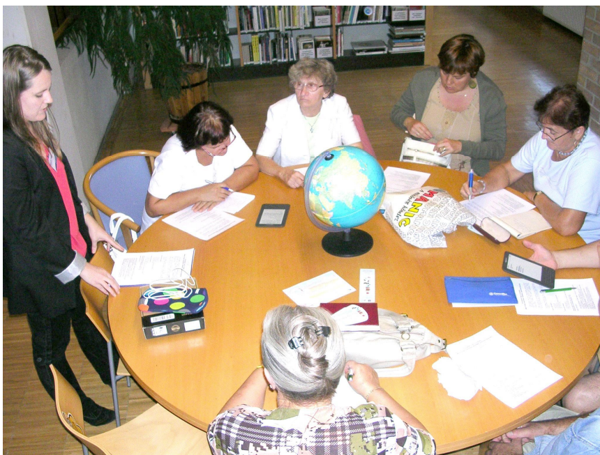
4. kép E-könyv reader használati kurzusunk

Legfontosabbnak azt tartottam, hogy a könyvtáros kollégák is ismerjék azt az eszközt, amit beszereztünk, így először számukra egy továbbképzéssel készültem, amikor bemutattam a még nem érintőképernyővel működő Kindle e-könyv olvasót. Az Internet Fiesták és Őszi Könyvtári napok elnevezésű rendezvénysorozataink alkalmával minden évben meghirdettük az e-könyv olvasó, valamint táblagép használati oktatásainkat. Jellemzően nyugdíjasok érdeklődtek a téma iránt, főleg az okból kifolyólag, hogy képesek legyenek a saját eszközük használatára.