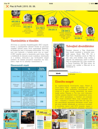
7. kép Digitális folyóirat egy oldala, alul gyors lapozósávval